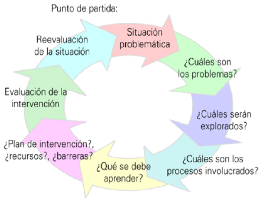
Fig 2 Ciclo de resolución de un problema del ABP

Las situaciones o problemas o casos que se presentan van dirigidos a adquirir conocimientos; en el Taller C los estudiantes aún pueden resolver problemas diagnósticos sencillos, programar planes de estudios y fundamentar estrategias terapéuticas, además de entender cuáles son las estructuras o funciones que se encuentran involucradas en el mismo.; se espera que usen estrategias de razonamiento para combinar y sintetizar la información presentada en el caso o problema en una o más hipótesis explicativas. A partir de lo aprendido pueden identificar los principios que puedan aplicarse para comprender otras situaciones problema y resolver el problema diagnóstico planteado. Al finalizar el análisis se espera que puedan evaluar lo aprendido y formular nuevas preguntas (ver ciclo de una exploración inicial del ABP según Branda). En cada caso clínico se incluyen aspectos biológicos, psicológicos, sociales, económicos y culturales que se refuerzan en los objetivos a lograr, esto da una comprensión en la presentación del problema que evita centrar el análisis solamente en el aspecto biológico y permite incluir una visión más amplia de la persona y su entorno. Esta presentación de nuevo modelo de aprendizaje busca sensibilizar a